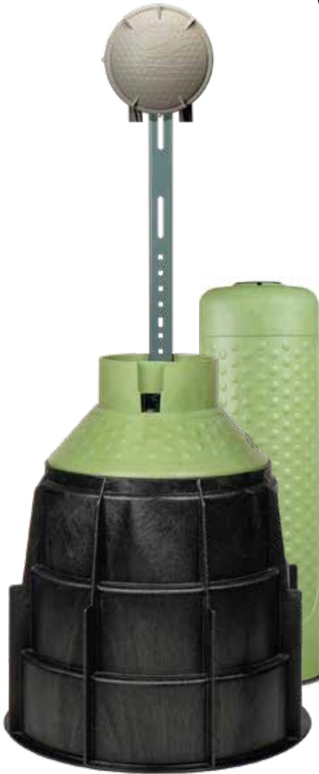
Montaje de pedestal