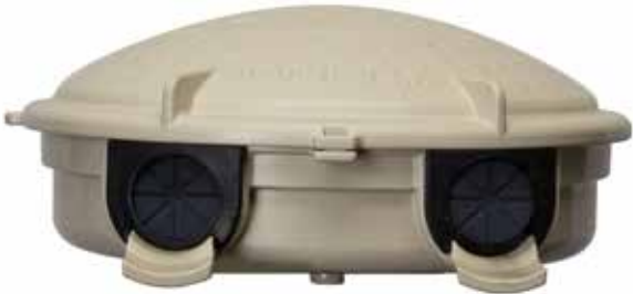
Ojales para montaje en pared

No se muestra: Montaje en estaca Montaje en poste Montaje en poste Montaje en revestimiento de vinilo