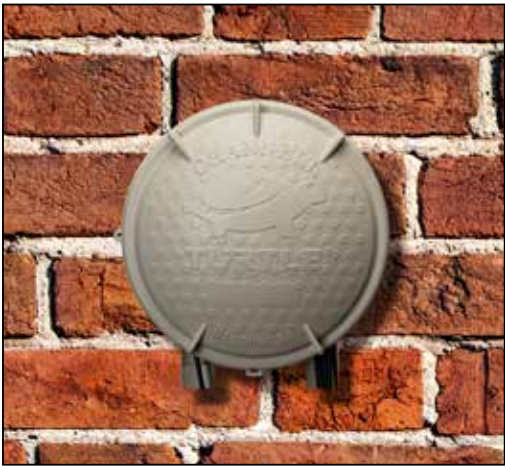
Montaje en pared

No se muestra: Montaje en estaca Montaje en poste Montaje en poste Montaje en revestimiento de vinilo