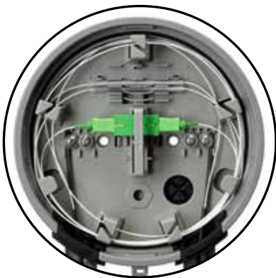
Almacenamiento de holgura de distribución