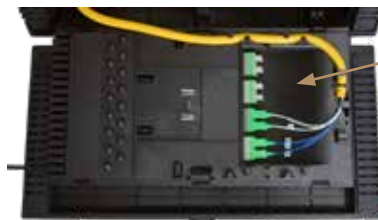
Descenso del lado izquierdo

La puerta del panel de terminales bidireccional permite conexiones de bajada desde cualquier lado sin herramientas, simplemente desabrochando y volteando la puerta del panel.