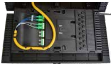
Descenso del lado derecho

El cable principal es bidireccional con entradas de izquierda o derecha y la entrada del cable de bajada brindan máxima flexibilidad en aplicaciones aéreas y evita la necesidad de adquirir e instalar hardware adicional.