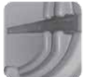
Zanja conjunta de 42" Juego (2 por ctn.) N/P ST01001

Diseñadas específicamente para albergar equipos pasivos, estas versiones especiales de los pedestales Channell CPH911, CPH920 y CPH1022 cuentan con bases de enterramiento directo con un diseño de nervadura alta que es menos probable que se incline o se incline y no requieren estacas para la instalación. Una cubierta especial autoubicable garantiza que los pedestales se bloqueen correctamente sin alineación adicional. Las cubiertas incluyen el hardware de seguridad Self-Lock™ de Channell.