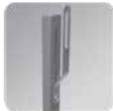
Soporte (B2 mostrado)