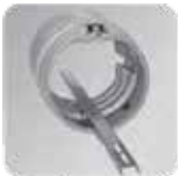
Apostar (Se muestra S2)