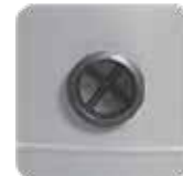
Caída preparada para el invierno (se muestra A1)