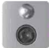
Cerrar (Se muestra L00)