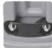
Autocalización Seguridad de la cubierta Receptor de bloqueo